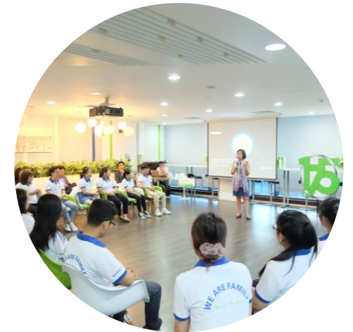
Chia sẻ cùng Chủ tịch Quỹ